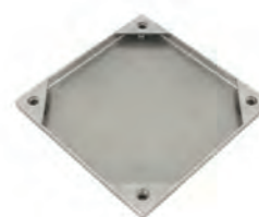
Capac acoperire ceramica

Gura de vizitare Kesmet este un produs de inalta calitate realizat in Polonia si corespunde standardelor Europene de calitate si igiena.