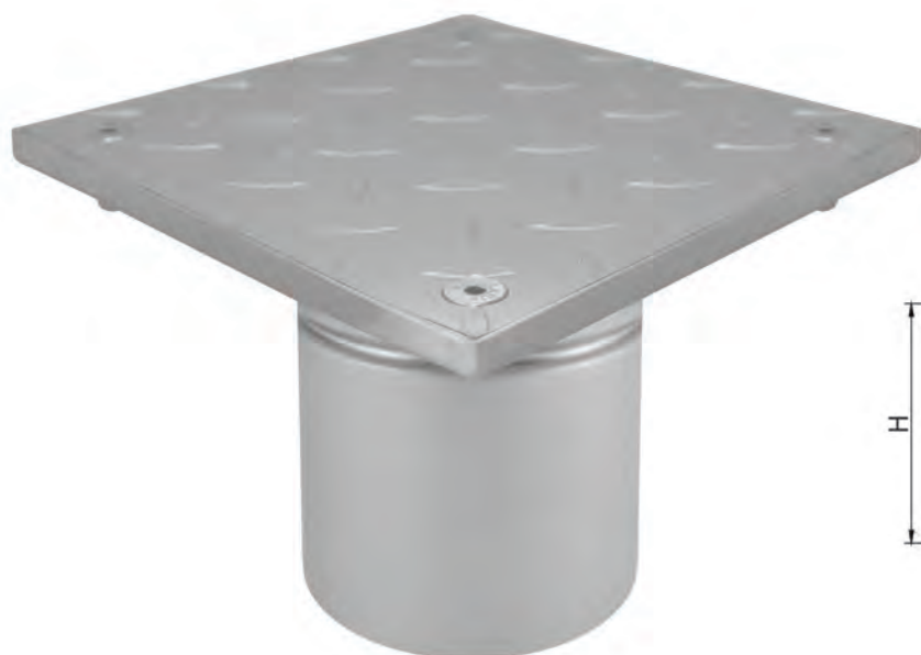
Gura de vizitare verticala - RC

Integral din otel inoxidabil AISI 304 - AISI 316